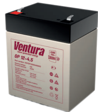
Габаритные размеры, мм